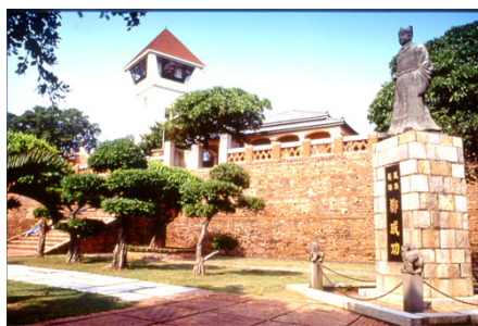
Tainan – Fort Anping