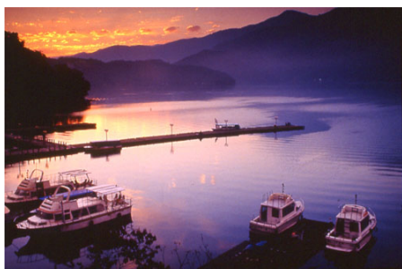
Sun Moon Lake