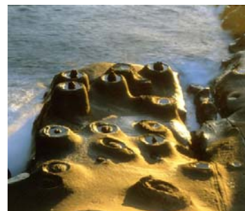
Yehliu Natural Park