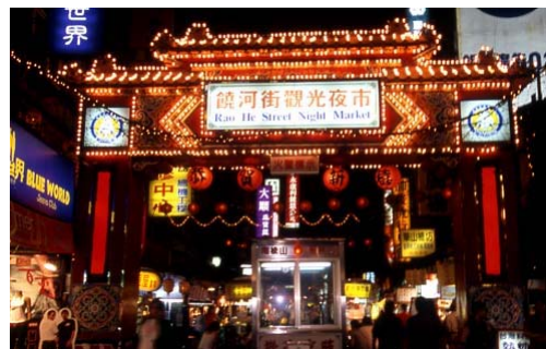
Rao-Ho Street Night Market