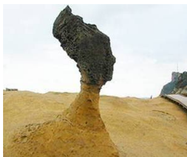
Yehliu Natural Park