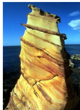
Nanya Rock Formations