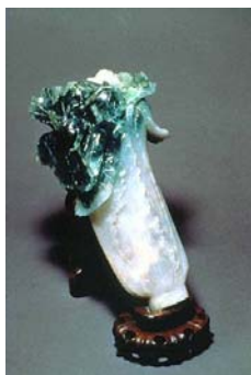
National Palace Museum

Arrêts : Chinese Temple, Presidential Square, Chiang Kai-Shek Memorial Hall, Martyrs' Shrine and the National Palace Museum Prix : CHF 35.— par personne y compris billets d'entrées et guide anglophone