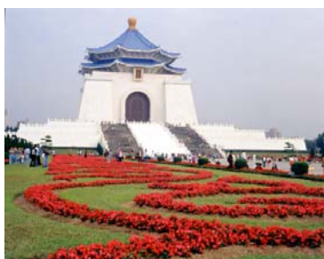
Chiang Kai-Shek Memorial Hall