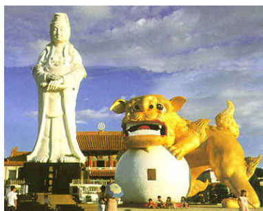
Chung Cheng Park

Arrêts: Chung Cheng Park, Statue of Goddess of Mercy, Yehliu Natural Park (Queen's Head, Fairy Shoe and many other natural rock formations) Prix : CHF 42.— par personne y compris billets d'entrées et guide anglophone