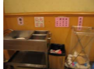
Place des ustensiles

Il est vrai que la plupart des Européens préfèrent se restaurer au Café mais où la nourriture sera payante. Ces 2 types de restauration s'adaptent aux différentes personnes. Un européen aime bien avoir son expresso après son repas !! En se rendant au Café, il y trouvera son bonheur....Ajoutons encore que dans le « Pilgrim's Lodge », on ne paie pas pour manger mais l'on peut donner un petit quelque chose aux personnes qui s'occupent de l'endroit.