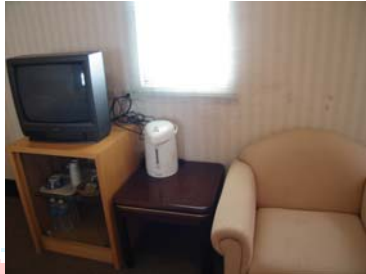
Télévision en couleur