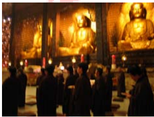
La prière du matin

La calligraphie est une activité forte intéressante puisqu'elle permet à des gens qui ne connaissent pas la langue chinoise de réécrire sur des symboles chinois déjà fait sur des feuilles et de prendre ensuite cela en souvenir.