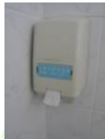
Savon et shampoing