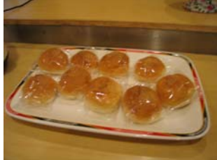
Pains du buffet végétarien